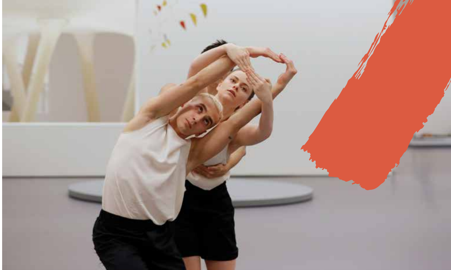
Foto: scene uit Intertwine in de Kunsthall

vernieuwend concept richt Scapino Ballet Rotterdam zich nadrukkelijk op een jonger publiek.