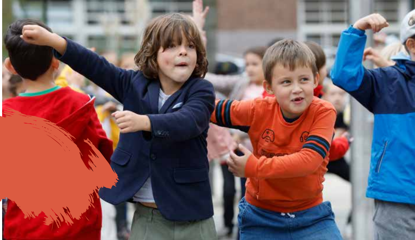
Foto: kinderen dansen op het schoolplein van de Amsterdamse Dongeschool

de mentale weerbaarheid van jongeren. Onze docenten gaan door middel van dans aan de slag met elementen als: verbeeldingskracht, gebruik van je lichaam in de ruimte, houding & kracht uitstralen, flexibel zijn, creativiteit, en het vermogen om iets negatiefs te kunnen ombuigen naar iets positiefs.