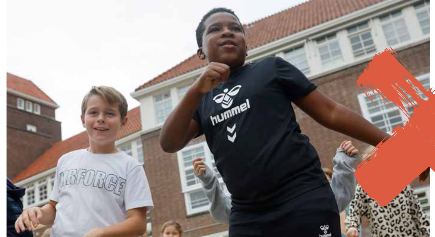
Foto: kinderen dansen op het schoolplein van de Amsterdamse Dongeschool

Het nagesprek werd live gestreamd voor publiek dat niet aanwezig kon zijn en ook zij hadden de mogelijkheid om online via de host interactie aan te gaan met de makers.